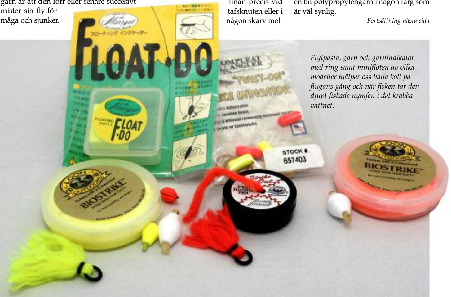
Flytpasta, garn och garnindikator med ring samt miniflötorna av olika modeller hjälper oss hålla koll på flugans gång och när fisken tar den djupt fiskade nymfen i det krabba vattnet.