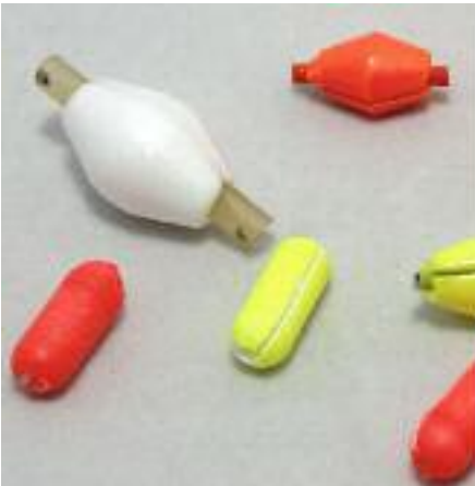
Miniflötorna är lätta att se men ger luftmotstånd och är lite besvärliga att kasta med.