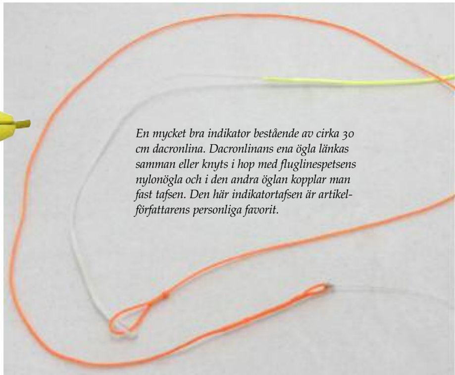
En mycket bra indikator bestående av cirka 30 cm dacronlina. Dacronlinans ena ögla länkas samman eller knyts i hop med fluglinespetsens nylonögla och i den andra ögla kopplar man fast tafsens. Den här indikator tafsens är artikel-författarens personliga favorit.

EN VANLIGT förekommande indikator typ som är populär särskilt i USA och på Nya Zeeland är den klassiska indikatorn av garn. I ändan på garnet är en liten gumming applicerad. Genom att trä tafsens dubbelvikt genom indikatorns gumming och därefter lägga den dubbelvikta tafsens över och runt garnets så sitter indikatorn fixerad på plats utan att börja glida. Nackdelen med en indikator av garn är att den förr eller senare succesivt mister sin flytför-måga och sjunker.